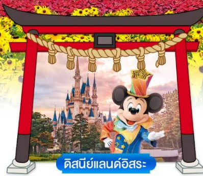
ดิสนีย์แลนด์อิสระ