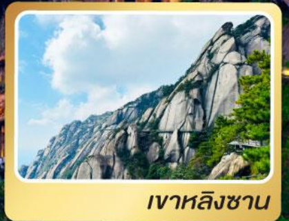
เงาหลิงซาน