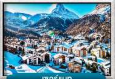
เซอร์แมท

บินหรู สายการบิน Full Service | พิเศษ! ลิ้มลองพองดู 3 ชนิด