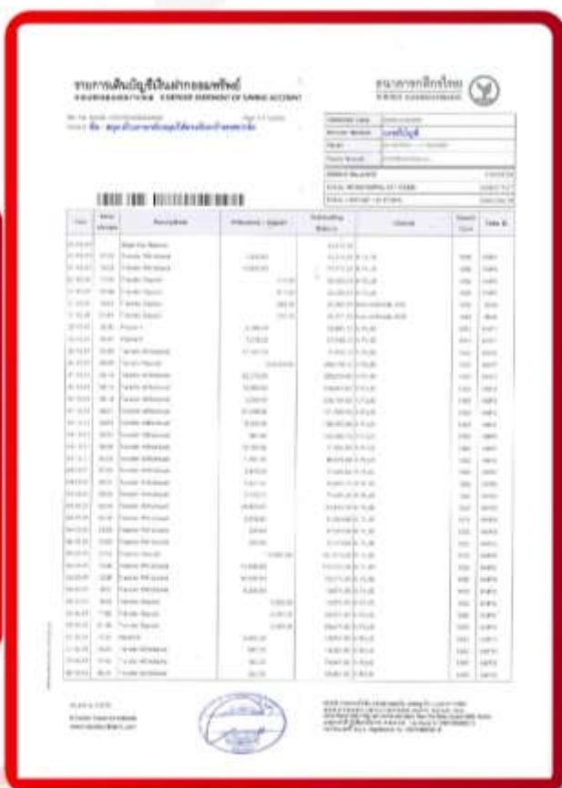
ตัวอย่าง Bank Statement ที่ผู้สมัครต้องยื่นธนาคาร

ตัวอย่างขนาดรูปถ่ายที่ตรงตามสถานทูตกำหนด