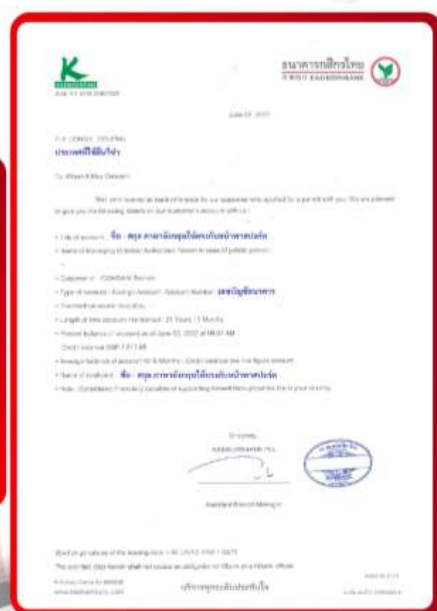
ตัวอย่าง Bank Guarantee ที่ผู้สมัครต้องยื่นธนาคาร