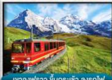
เขา Jungfrau ขึ้นกระเช้า ลงรถไฟ